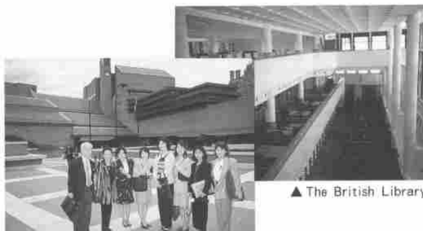
▲ The British Library