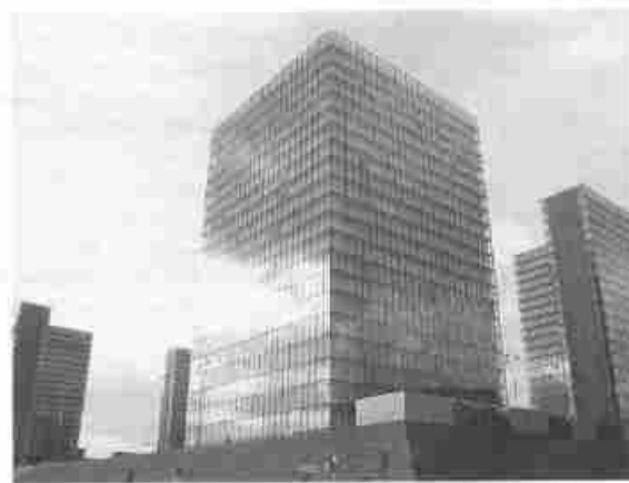
▲ Bibliothèque nationale de France